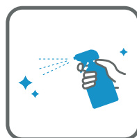
館内共有部の消毒強化 Strengthening disinfection