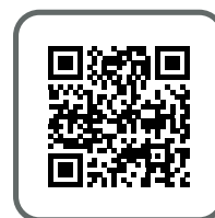
感染防止対策のご案内はこちら More information