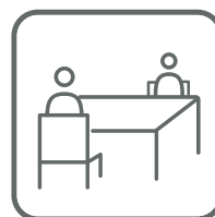
席の間隔をあける Spacing seats