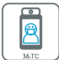
体温の測定 Taking a temperature