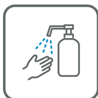
手指のアルコール消毒 Alcohol disinfection