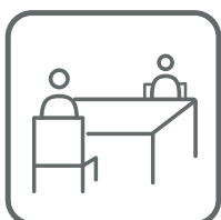
席の間隔をあける Spacing seats