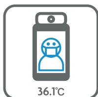
体温の測定 Taking a temperature