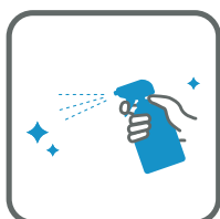
館内共有部の消毒強化 Strengthening disinfection