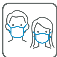
マスク着用 Putting a mask