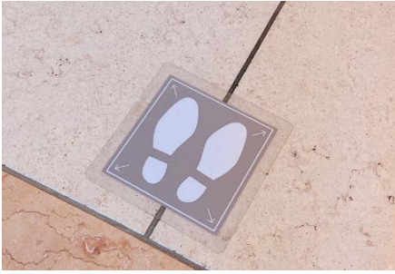
ソーシャルディスタンスの足もとマーク