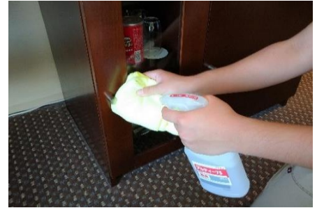
スナック類の棚の取っ手消毒