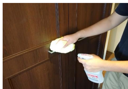
クローゼット取っ手の消毒