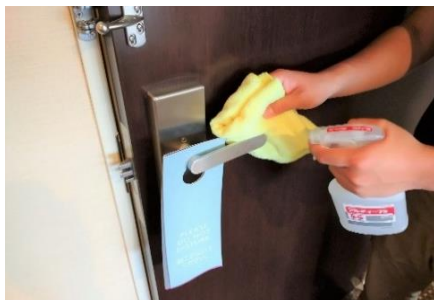
部屋内のドアノブの消毒