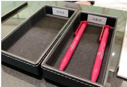
ペンの分別(使用済・消毒済)