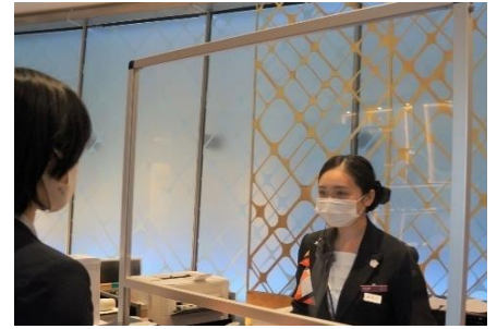
飛沫感染防止シールド設置