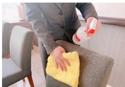
椅子(お客様用椅子含む)の消毒