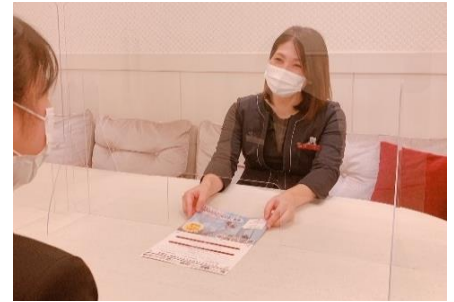
打ち合わせ会場に飛沫感染防止シールド設置