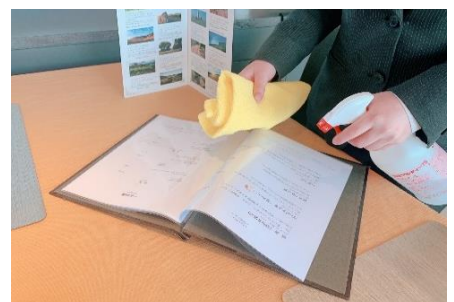
メニューブックの消毒