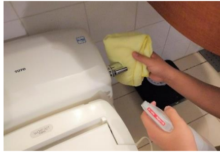
トイレレバーの消毒