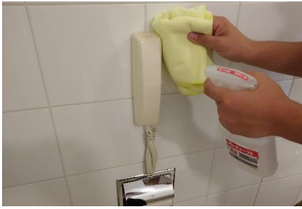
バスルーム内電話の消毒