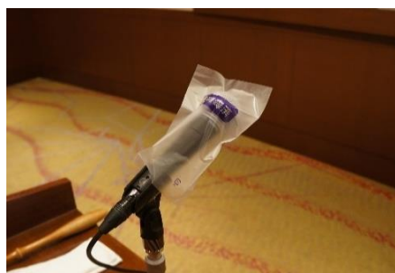
マイクの消毒と消毒済カバーの取付け