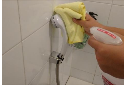
シャワーヘッドの消毒