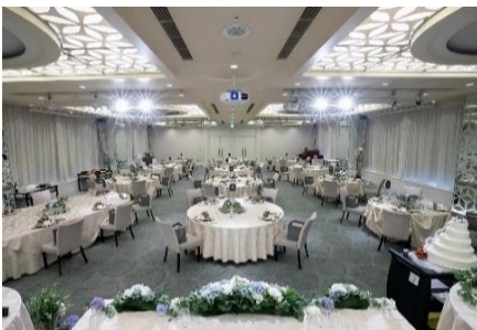
テーブル間の間隔確保