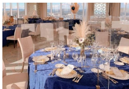
テーブルのシールド設置(ご要望に応じて)