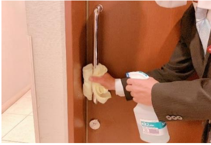
障害者用トイレの手すり消毒