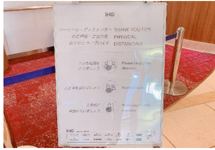
ソーシャルディスタンスご協力のご案内