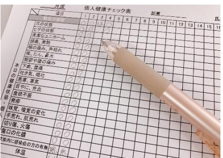
毎日健康チェックシートへ記入