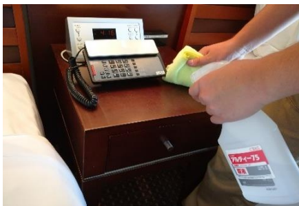
ナイトテーブルの消毒