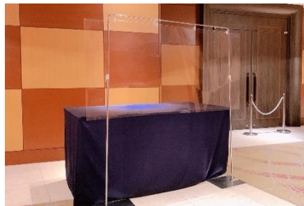
受付のシールド手配(ご要望に応じて)