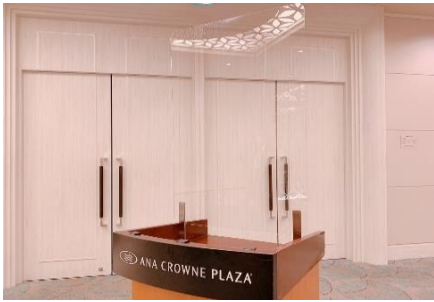
司会台のシールド設置(ご要望に応じて)