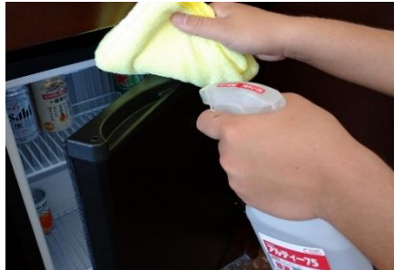
冷蔵庫取っ手部分の消毒