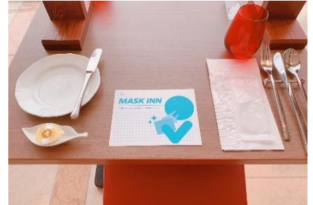
使い捨てマスクケースの配布