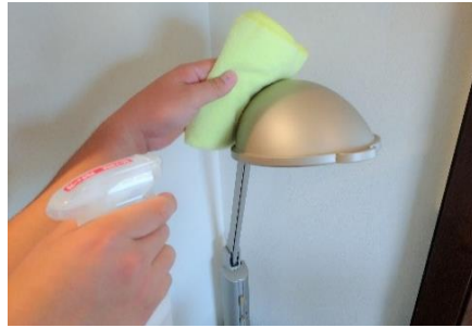
ライトスタンドの消毒