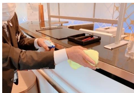
カウンターの消毒