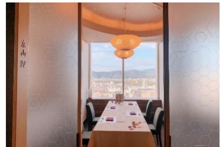
個室扉の開放(ご要望に応じて)