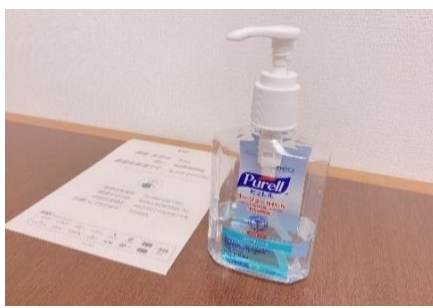
消毒液設置と本体の定期的な消毒