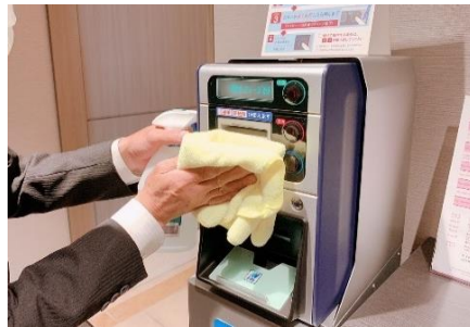
チャージ機械の消毒