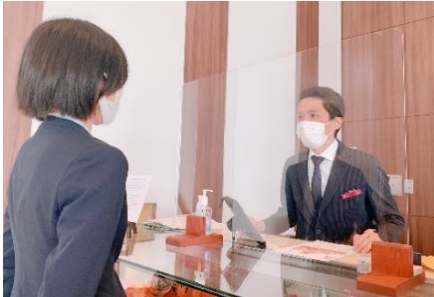
キャッシャーに飛沫感染防止シールド設置