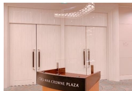
司会台のシールド設置(ご要望に応じて)