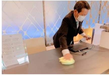
デスク・チェア・パソコンの消毒