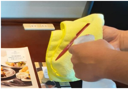
ボールペンの消毒