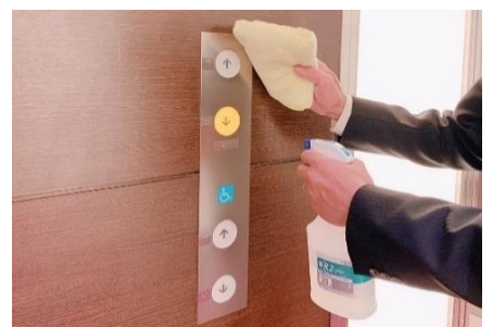
エレベーターボタンの消毒