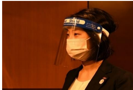
フェイスシールド手配(ご要望に応じて)