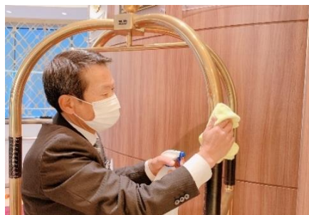
荷物用台車の消毒