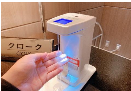
消毒液設置と本体の定期的な消毒