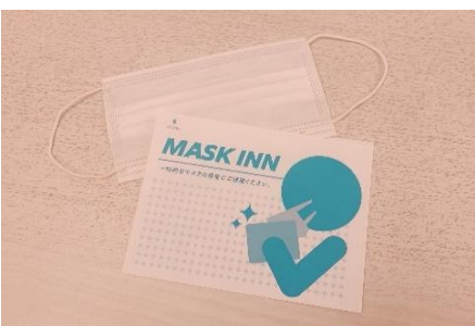
使い捨てマスクケースの配布