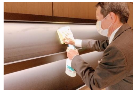
パンフレットラックの消毒