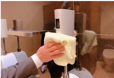
人感センサーの消毒