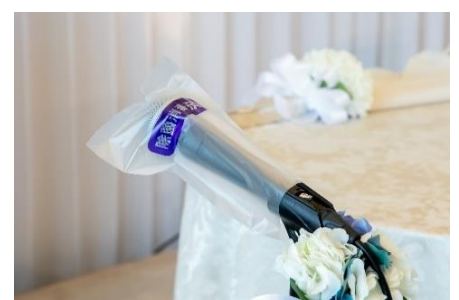
マイクの消毒と消毒済カバーの取付け