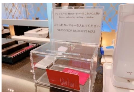
ルームキーの消毒&使用済回収BOX