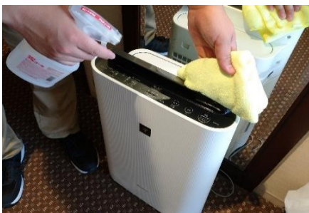
空気清浄機の消毒