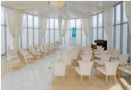
チャペル内 椅子の間隔確保