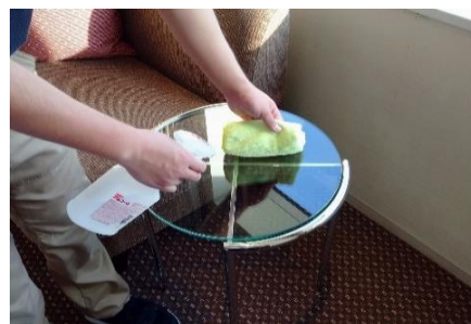
ティーテーブルの消毒