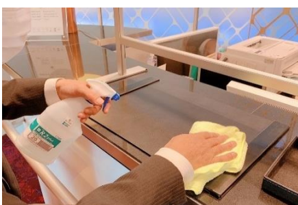
デスクマットの消毒