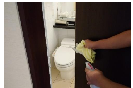
お手洗いドアノブの消毒