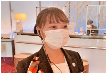
全従業員(テナント含む)マスク着用