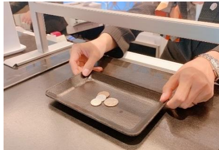
金銭授受はトレイを使用