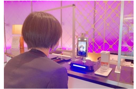
検温と健康状態の確認