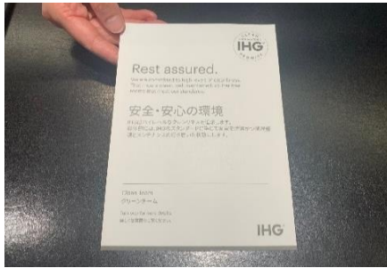
IHGクリーンプロミスカードの設置