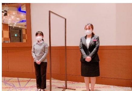
壇上の仕切りパネル(ご要望に応じて)