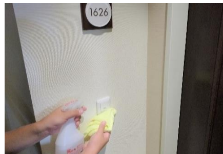
チャイムボタンの消毒