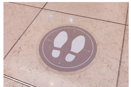
ソーシャルディスタンスの足もとマーク