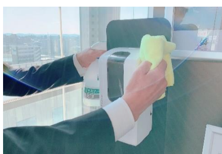
消毒液設置と本体の定期的な消毒