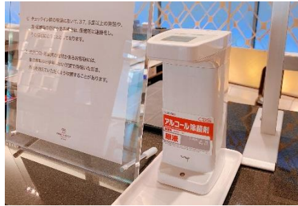
消毒液設置と本体の定期的な消毒