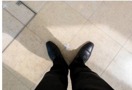
チャペル内 立ち位置確保のマーク