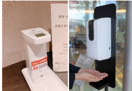
消毒液設置と本体の定期的な消毒