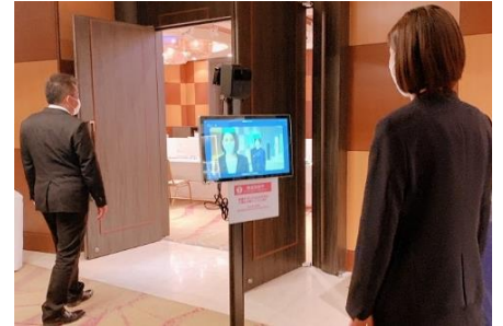
検温(非接触型検温器)と健康状態確認