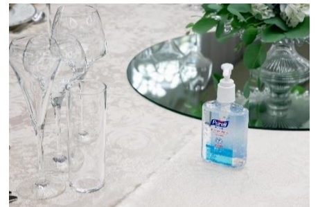
テーブル上に消毒液設置