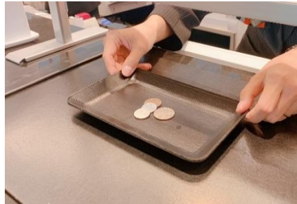
金銭授受はトレイを使用