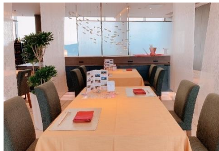
対面着席にならないようご案内