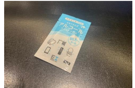
アルコール消毒シート配布