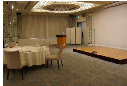
ステージとテーブルとの間隔確保