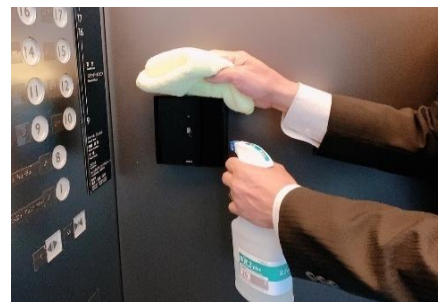
カードリーダーの消毒