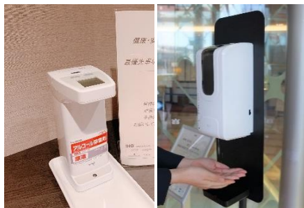
消毒液設置と本体の定期的な消毒