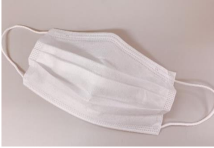
マスク着用と手指消毒のお願い