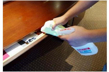
デスク引き出し持ち手の消毒