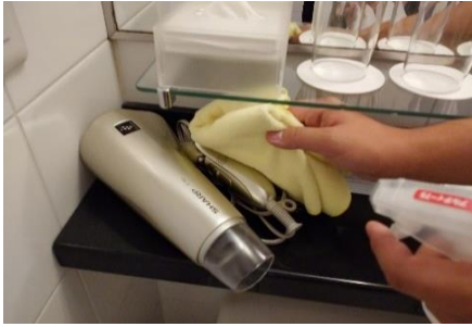
ドライヤーの消毒