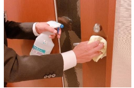
フィッティングルームの手すり消毒