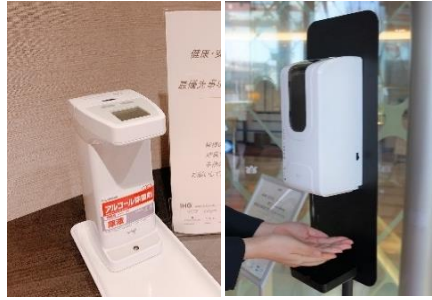
消毒液設置と本体の定期的な消毒