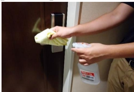
通路側客室ドアノブの消毒