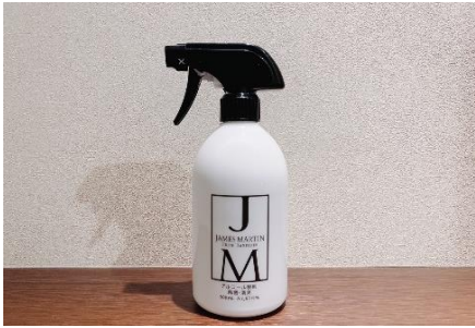
アルコール消毒液の設置