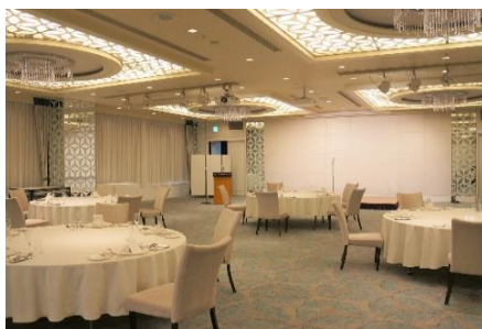
テーブル間の間隔確保