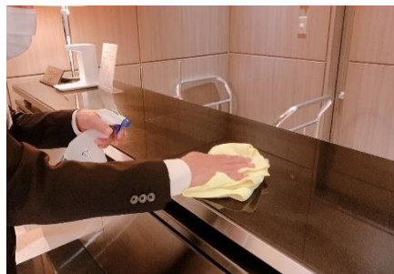
カウンターの消毒