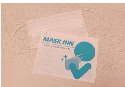
使い捨てマスクケースの配布