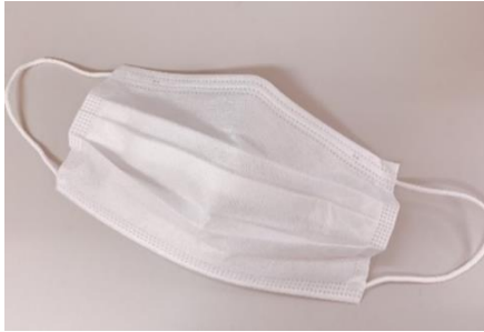
マスク着用と手指消毒のお願い