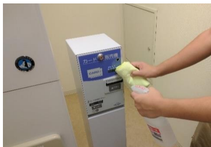
VOD販売機ボタンの消毒