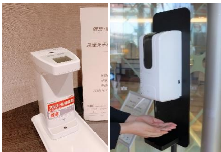
消毒液設置と本体の定期的な消毒