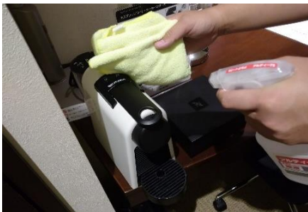
コーヒーマーカーの消毒