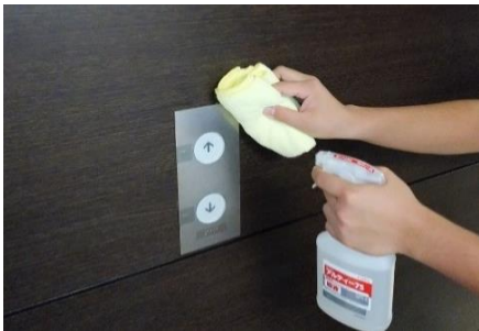
エレベーターボタンの消毒