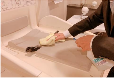
おむつ交換代の消毒