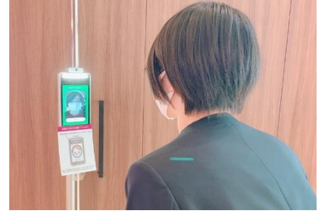
検温と健康状態の確認