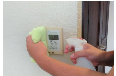
空調パネルの消毒