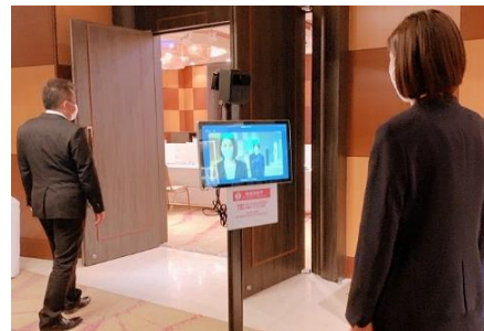
検温と健康状態の確認