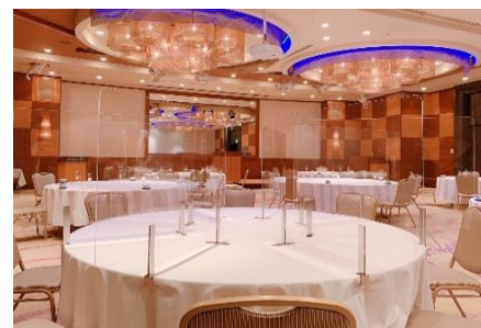
テーブルのシールド設置(ご要望に応じて)