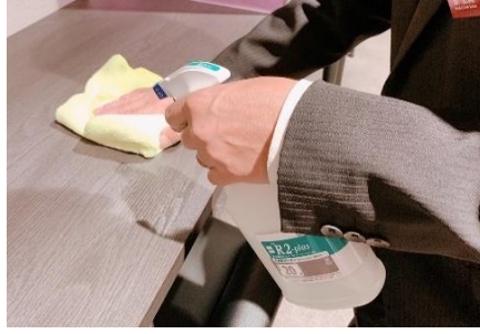
カウンターの消毒