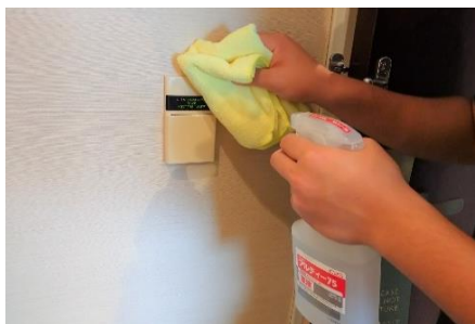
ルームキー差し込みの消毒