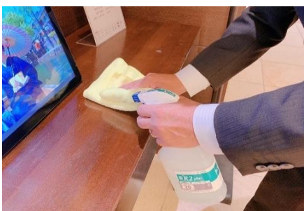
ディスプレイ棚の消毒