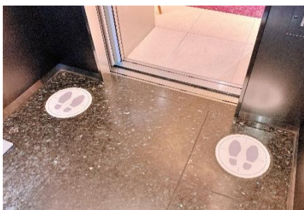
ソーシャルディスタンスの足もとマーク