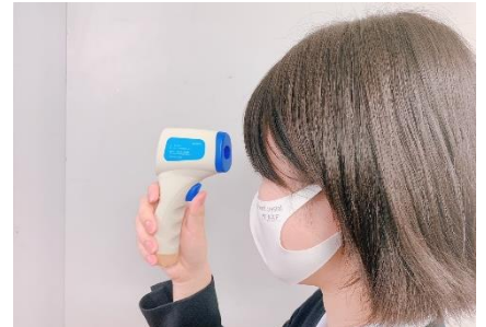
検温(非接触型検温器)