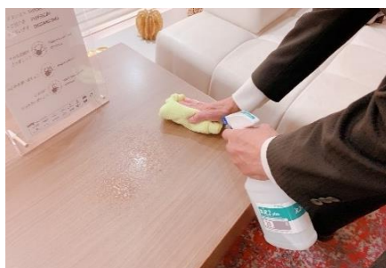
ソファサイドテーブルの消毒