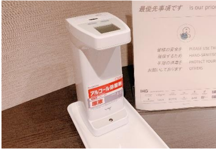
消毒液設置と本体の定期的な消毒