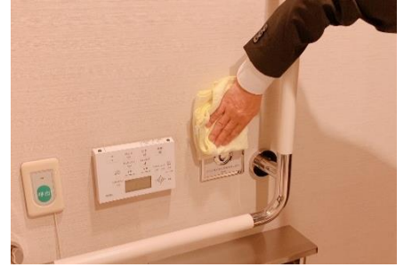
各種ボタンの消毒