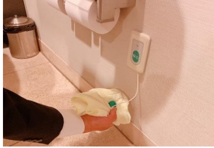
非常レバーの消毒