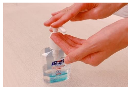
各作業毎に手指の消毒