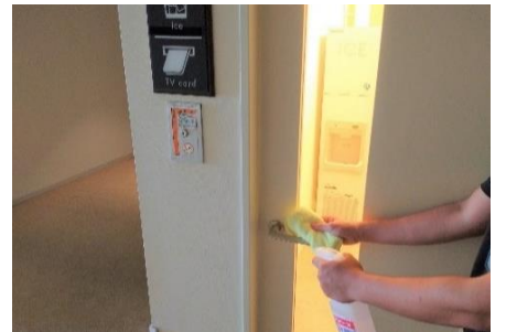
ペンダールーム ドアノブの消毒