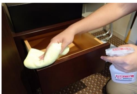
引き出しの持ち手の消毒