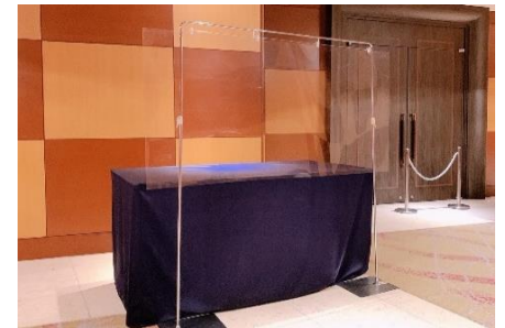
受付のシールド手配(ご要望に応じて)