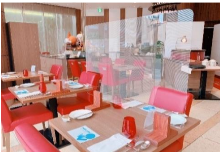
飛沫感染防止シールド設置