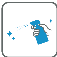
館内共有部の消毒強化 Strengthening disinfection