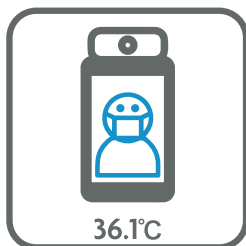
体温の測定 Taking a temperature